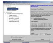
Messverfahren nur auswählen