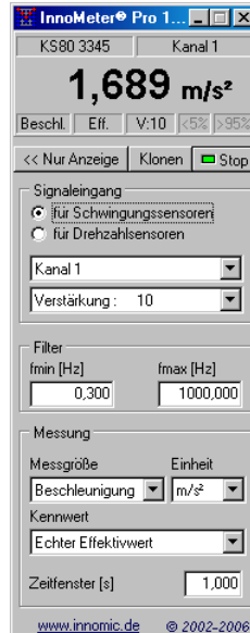
InnoMeter Pro - Schwingungssensoren